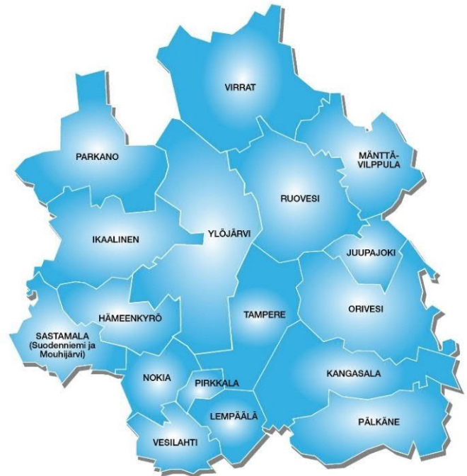
Kuva 1 Jätehuoltoviranomaisen toiminta-alue

Yhteistoiminta-alueeseen kuuluu 17 Pirkanmaan kuntaa: Hämeenkyrö, Ikaalinen, Juupajoki, Kangasala, Lempäälä, Mänttä-Vilppula, Nokia, Orivesi, Parkano, Pirkkala, Pälkäne, Ruovesi, Sastamala (entisten Mouhijärven ja Suodenniemen osalta), Tampere, Vesilahti, Virrat ja Ylöjärvi. Toimialueella on noin 457 000 asukasta ja noin 39 500 vapaa-ajan asuntoa. Tampereen kaupunki toimii jätehuollon yhteistoiminta-alueen isäntäkuntana.